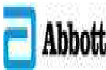
image001.jpg 2 KB

This communication may contain information that is proprietary, confidential, or exempt from disclosure. If you are not the intended recipient, please note that any other dissemination, distribution, use or copying of this communication is strictly prohibited. Anyone who receives this message in error should notify the sender immediately by telephone or by return e-mail and delete it from his or her computer.