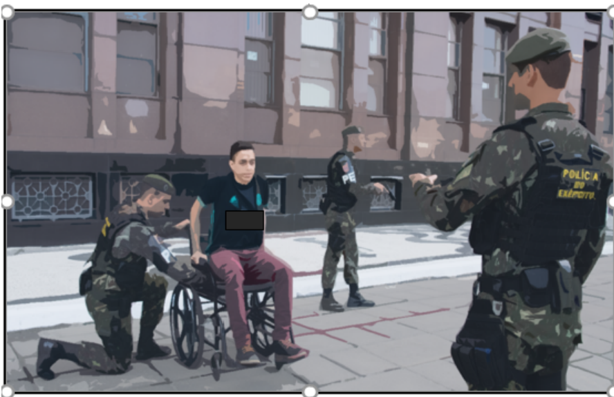
Fig 3: cadeirante consegue se erguer da cadeira com o auxílio dos braços e o militar 3 procede a revista.