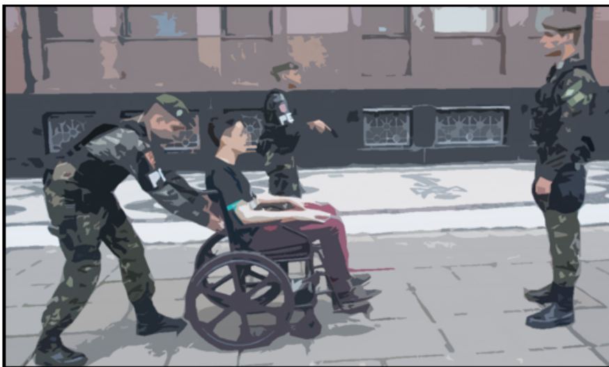
Fig 7: após revistar a pessoa, o militar 3 inspeciona a cadeira e os seus compartimentos.