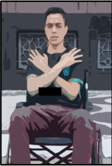
Fig 4: cadeirante não consegue se erguer e recebe a ordem para cruzar os braços a frente do corpo.