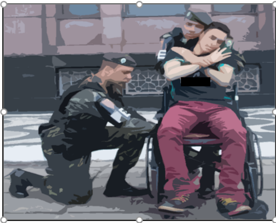
Fig. 6: militar 3 executa a revista.