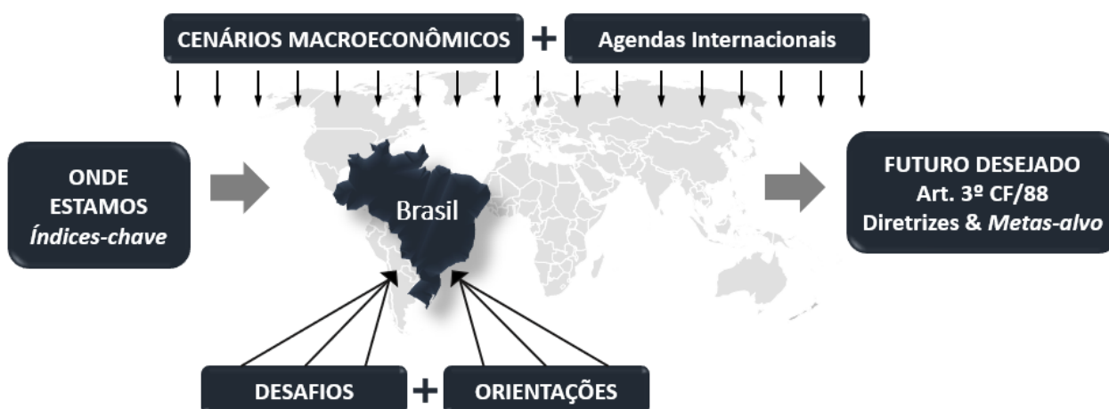
Metodologia da EFD 2020-2031