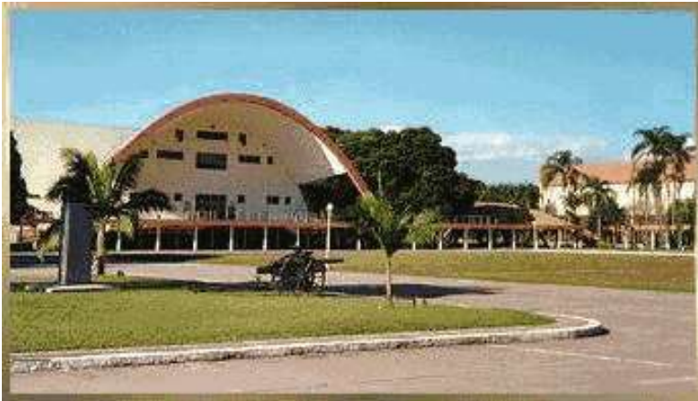
Centro de Instrução Almirante Sylvio de Camargo (CIASC)