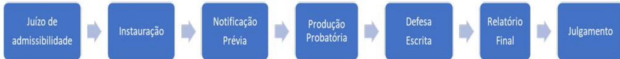
Figura 2. Fluxograma da Sindicância Disciplinar com termo de indicição (ocasiões em que, durante a instrução, forem apontados fatos descobertos no curso da apuração, os quais não constavam no juízo de admissibilidade ou no ato de instauração):