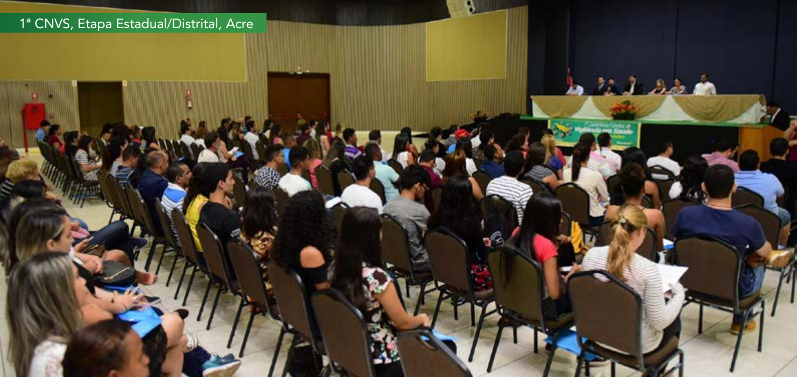
1ª CNVS, Etapa Estadual/Distrital, Acre