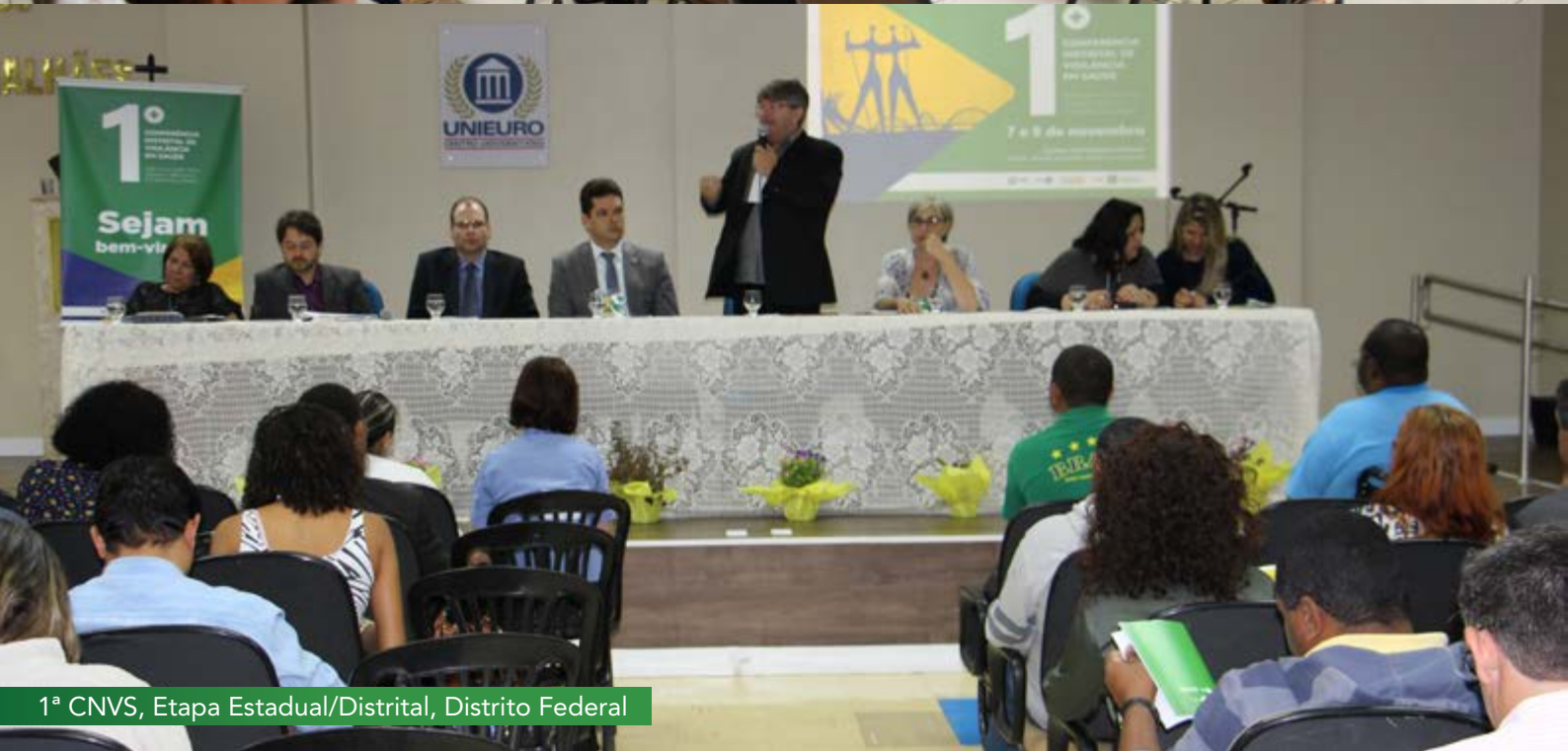
1ª CNVS, Etapa Estadual/Distrital, Distrito Federal