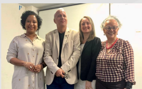
Arquivo Público Municipal de São Cristóvão