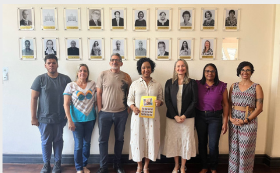
Arquivo Público Estadual de Sergipe