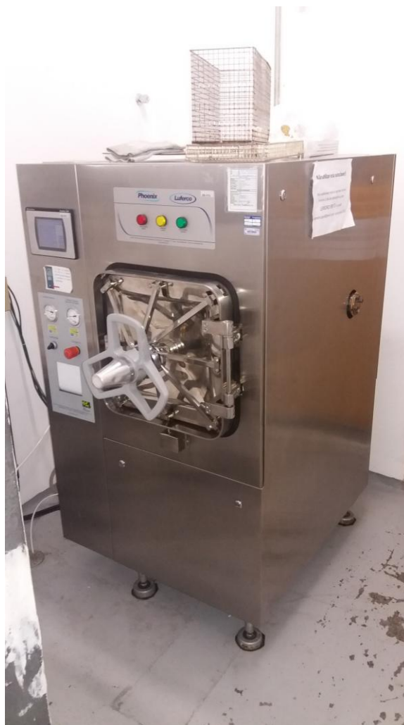
Figura 2 - 4.4.2. Equipamento 02