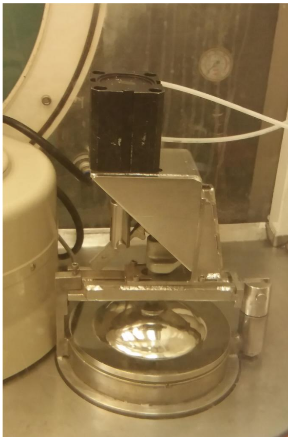
Figura 5 - Equipamento 05