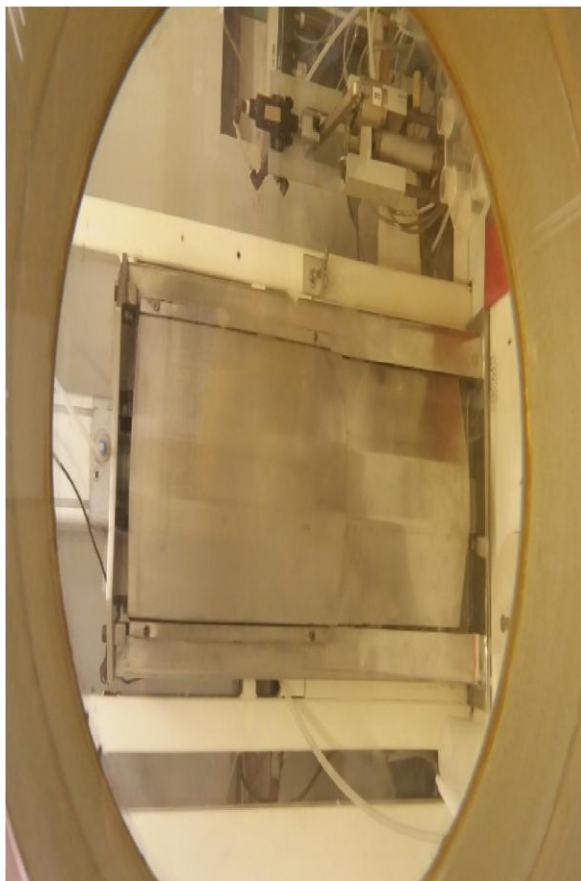
Figura 4 - Equipamento 04