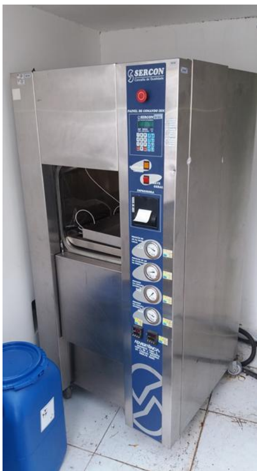
Figura 1 - Equipamento 01