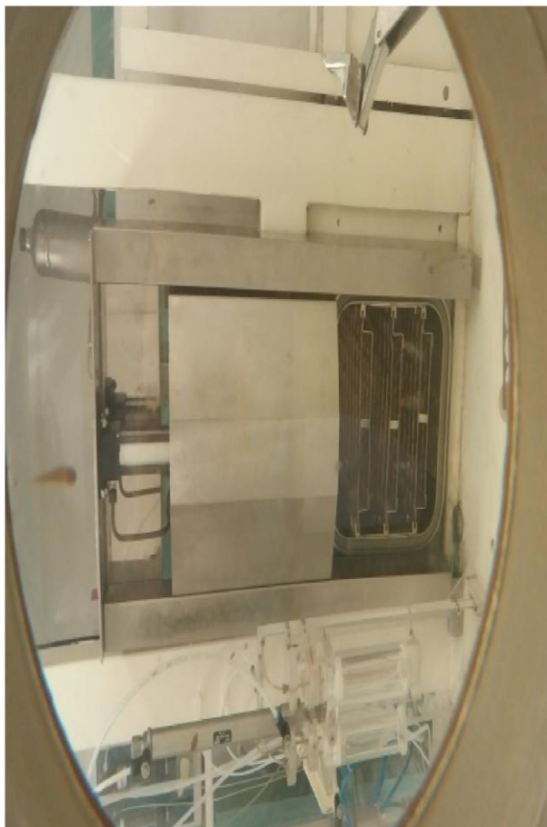
Figura 3 - Equipamento 03