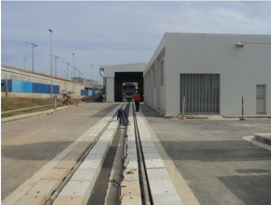
Oficina do Pátio Auxiliar de Manutenção - PAM

DESCRIÇÃO: Implantação completa do trecho Lapa a Acesso Norte, com 6 km de extensão, sendo 1,5 km subterrâneo e 4,5 km em elevado, 5 estações, sendo 2 com integração e aquisição de 6 trens elétricos de 4 carros