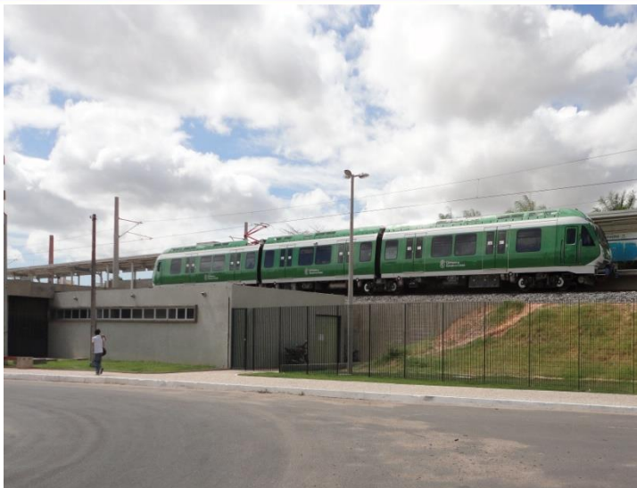
TUE na Estação Mondubim

DESCRIÇÃO: Implantação completa da Linha Sul, trecho Carlito Benevides a Chico da Silva, com duplicação e eletrificação da via e implantação de sinalização e de telecomunicações