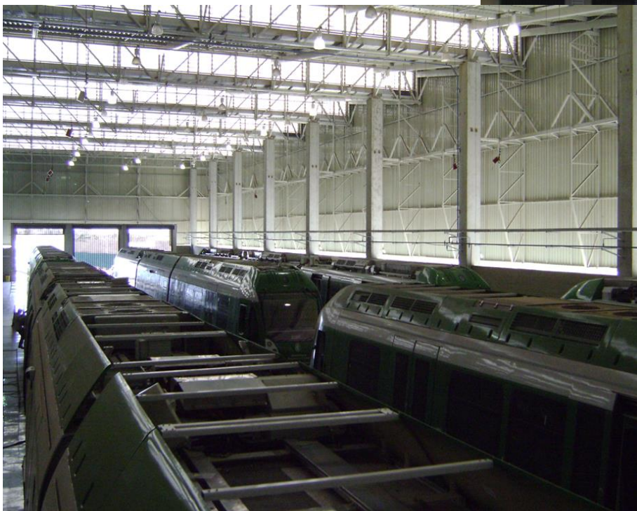
TUEs da Linha Sul