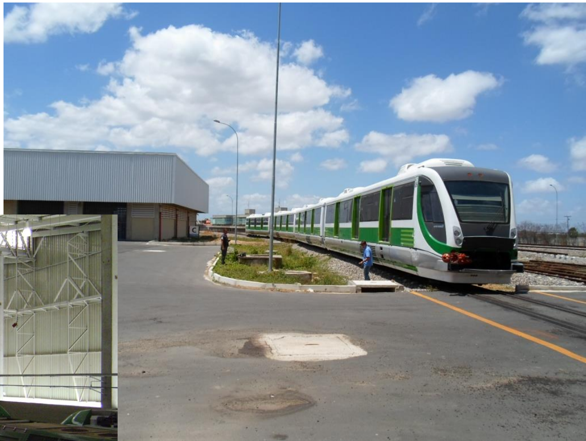
VLT da Linha Oeste