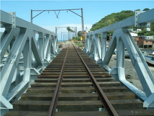
Ponte São João

DESCRIÇÃO: Modernização do sistema de trens metropolitanos no trecho Calçada a Paripe, com 13,5 km de extensão, 10 estações, 2 terminais de integração e 6 trens elétricos de 4 carros