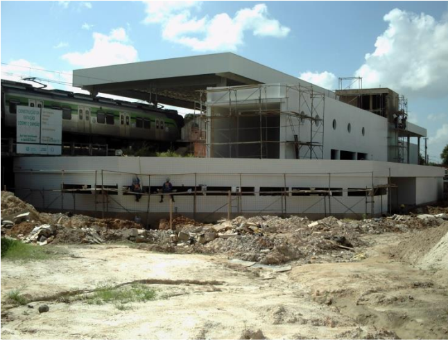
Estação Cosme e Damião – Estação da Copa

DESCRIÇÃO: Implantação de 6 terminais de integração da Linha Sul eletrificada; duplicação e modernização da Linha Sul diesel de Cajueiro Seco a Cabo, modernização de 5 estações e aquisição de 7 trens leves a diesel com 3 carros; conclusão da expansão da Linha Centro eletrificada, das estações Rodoviária a Camaragibe, com implantação da estação Cosme e Damião