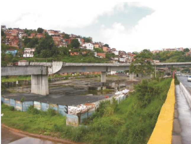
Viaduto da BR-324

DESCRIÇÃO: Implantação completa do trecho Acesso Norte a Pirajá, com 6,1 km de extensão, sendo 1,4 km em elevado e 4,7 km em superfície, 3 estações, sendo 1 com integração e aquisição de 6 trens elétricos de 4 carros