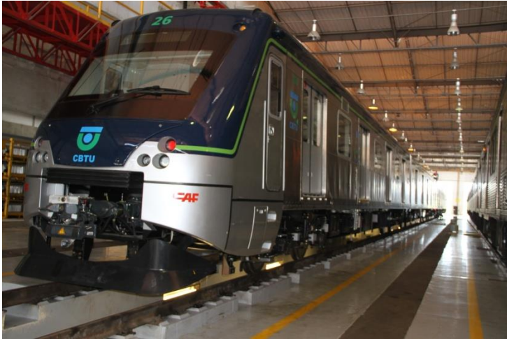
TUE Entregue em Recife

DESCRIÇÃO: Aquisição de 15 novos trens elétricos para a Linha Sul.