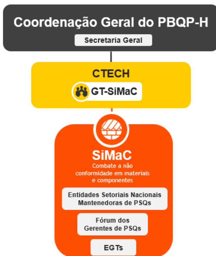
Figura 1 – estrutura do SiMaC.

Art. 6º O CTECH atua no assessoramento à Coordenação Geral do PBQP-H na implementação e operacionalização do SiMaC.