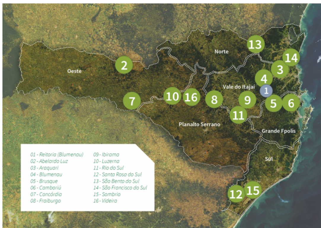
Figura 01 – Mapa de abrangência institucional

O IFC possui atualmente 15 campi , distribuídos nas cidades de Abelardo Luz, Araquari, Blumenau, Brusque, Camboriú, Concórdia, Fraiburgo, Ibirama, Luzerna, Rio do Sul, Santa Rosa do Sul, São Bento do Sul, São Francisco do Sul, Sombrio e Videira, além da Reitoria instalada na cidade de Blumenau.