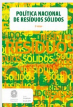
POLÍTICA NACIONAL DE RESÍDUOS SÓLIDOS