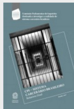
CPI - SISTEMA CARCERÁRIO BRASILEIRO: RELATÓRIO