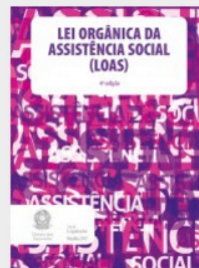
LEI ORGÂNICA DA ASSISTÊNCIA SOCIAL - LOAS