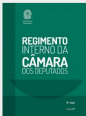
REGIMENTO INTERNO DA CÂMARA DOS DEPUTADOS