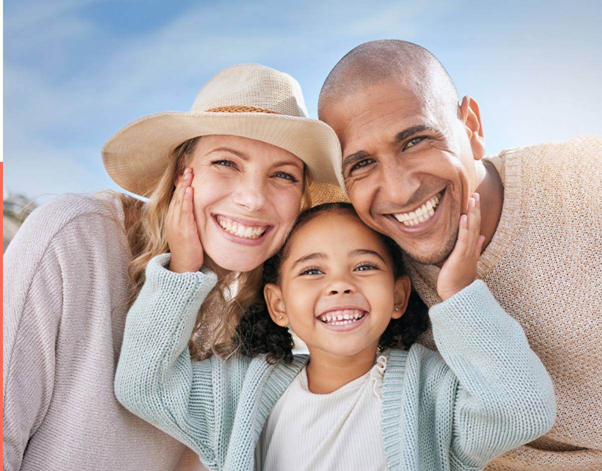
Tabela de Valores Convênio com a União