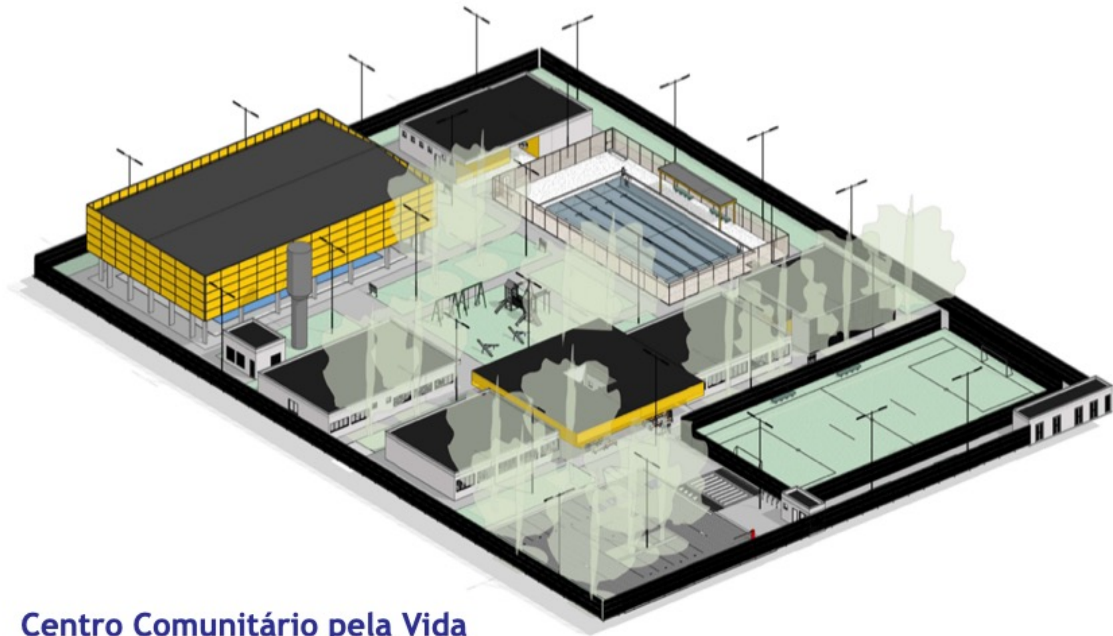
Centro Comunitário pela Vida