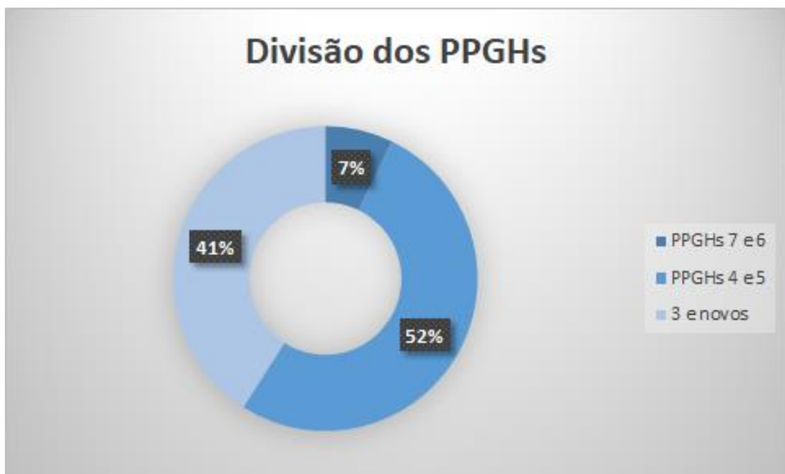
Gráfico 3: Divisão dos PPGH

Esses gráficos evidenciam uma concentração dos PPGH nos estratos inferiores (NOTAS 3 e 4) e um percentual muito baixo de programas de excelência (NOTAS 6 e 7). Ao nosso ver essa pirâmide de distribuição dos PPGH nos estratos é a principal assimetria da Área de História no momento.