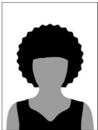
Figura 01 - Modelo de foto frontal