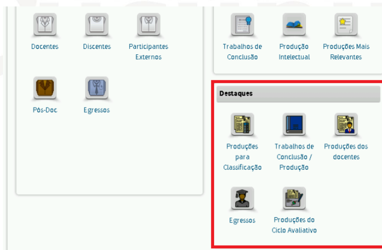
Figura 1. Módulo de destaques na Plataforma Sucupira

Conforme apresentado no Boletim Informativo nº 38 disponível na Plataforma Sucupira (Portal do Coordenador > Apoio ao preenchimento > Boletins) e nas páginas das áreas que possuem PROF, o perfil do Coordenador de Programa de Pós-graduação conta com o módulo de Destaques, no qual os programas poderão, após preencherem todas as informações no Coleta, marcar quais produções e egressos são destaques. ( Figura 1 ).