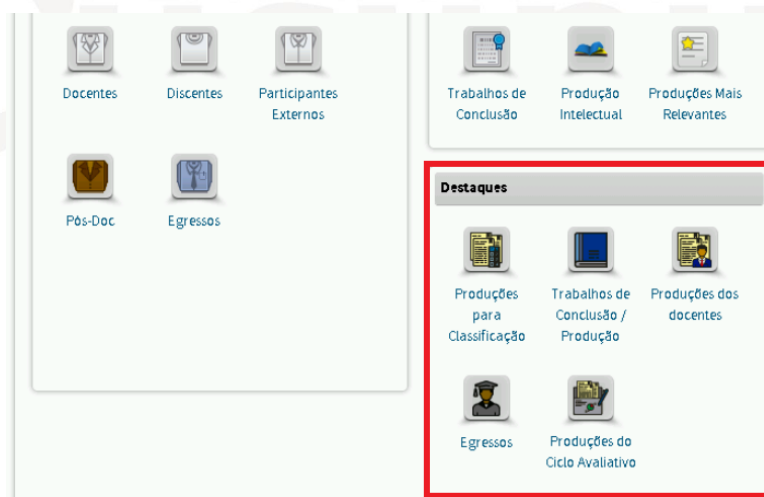
Figura 1. Módulo de destaques na Plataforma Sucupira

Conforme apresentado no Boletim Informativo nº 38 disponível na Plataforma Sucupira (Portal do Coordenador > Apoio ao preenchimento > Boletins) e nas páginas das áreas que possuem PROF, o perfil do Coordenador de Programa de Pós-graduação conta com o módulo de Destaques, no qual os programas poderão, após preencherem todas as informações no Coleta, marcar quais produções e egressos são destaques. ( Figura 1 ).