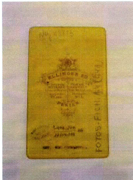
Fig. 1 – Modelo de carimbagem e atribuição de número de registro em documento bibliográfico