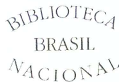
Fig. 3 – Modelo de carimbo de propriedade da Biblioteca Nacional