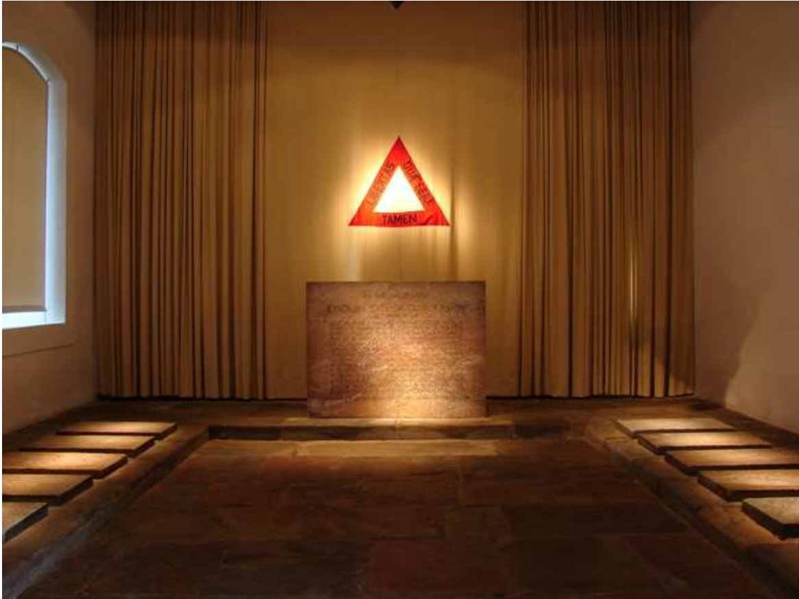
Foto Panteão da Inconfidência.