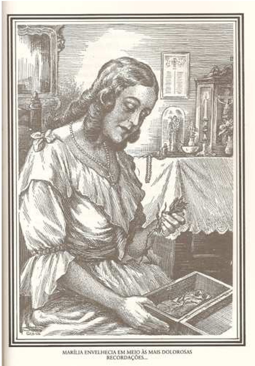
Ilustração feita por Seth. In: Lima Jr., 1998, p. 127.