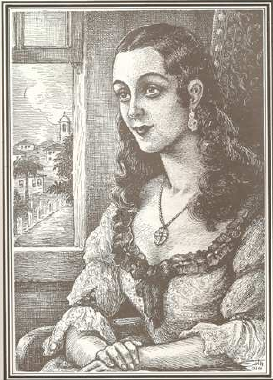
MARÍLIA AOS 19 ANOS

Ilustração feita por Seth. In: Lima Jr., 1998, p. 39.