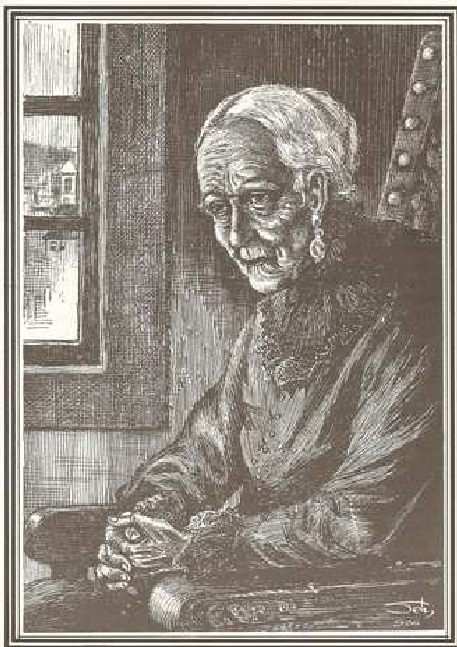
MARÍLIA NA EXTREMA VELHICE SOMENTE VIVIA DO PASSADO.

Ilustração feita por Seth. In: Lima Jr., 1998, p. 139.