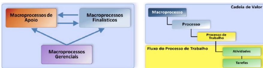
Figura 1: Relação entre macroprocessos

5. Segundo a metodologia proposta pela equipe do TransformaGov a Cadeia de Valor Integrada prevê a classificação dos macroprocessos em três categorias que se integram e se complementam: macroprocessos gerenciais (de gestão), finalísticos (primário, de negócio) e de suporte (de apoio). Além da classificação presente na cadeia de valor, tem-se a abordagem da arquitetura dos processos que se apresentam em cinco níveis: macroprocessos, processos, processos de trabalho ou serviços, atividades e tarefas.