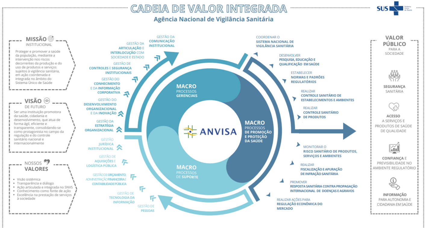
Figura 2: Cadeia de Valor Integrada da Anvisa

10. Os demais níveis são representados em fluxos de processos que subsidiam a execução dos serviços e processos organizacionais.