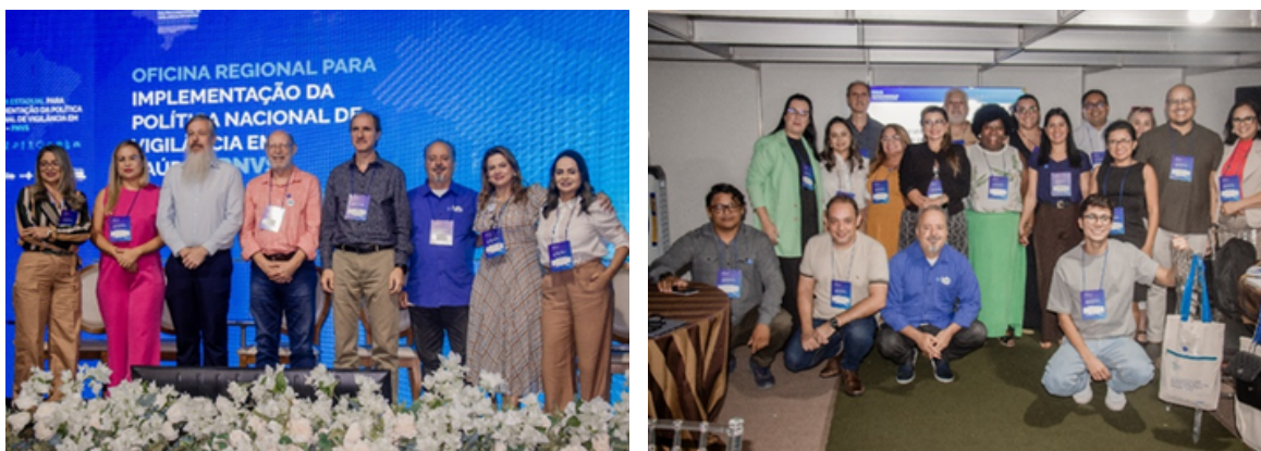
Figura 2 - Oficina Estadual para Implementação da Política Nacional de Vigilância em Saúde (PNVS) em Macapá, Amapá.

A oficina, que também ocorrerá em outros estados de diferentes regiões do País ao longo do ano de 2025, reforçou a importância da colaboração entre diferentes esferas de governo e profissionais de saúde para garantir a eficácia da PNVS e promover a equidade nos serviços de saúde.