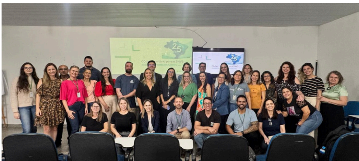
Figura 3 - Oficina Presencial do Código Sanitário em Foz do Iguaçu, no Paraná.

Ambos eventos constituíram uma das etapas para a construção dos códigos sanitários atualizados conforme as diretrizes estabelecidas pelo “Manual para Elaboração do Código Sanitário para o Sistema Nacional de Vigilância Sanitária (SNVS)”. O objetivo principal do projeto é promover maior eficiência e qualidade na regulação sanitária no território nacional, além da harmonização dos procedimentos, de modo a garantir a previsibilidade jurídica, que promove um ambiente favorável ao desenvolvimento dos negócios.