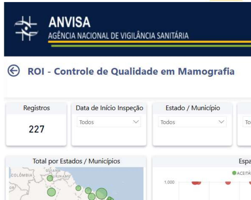
Fonte: painel de monitoramento dos ROI -01/11/2024

Com chuvas de corações, agradecemos as valiosas contribuições das Visa: PI, DF, Belém/PA, MS, CE, PB, GO, Ibiporã/PR, Ivaiporã/PR e Pato Branco/PR.