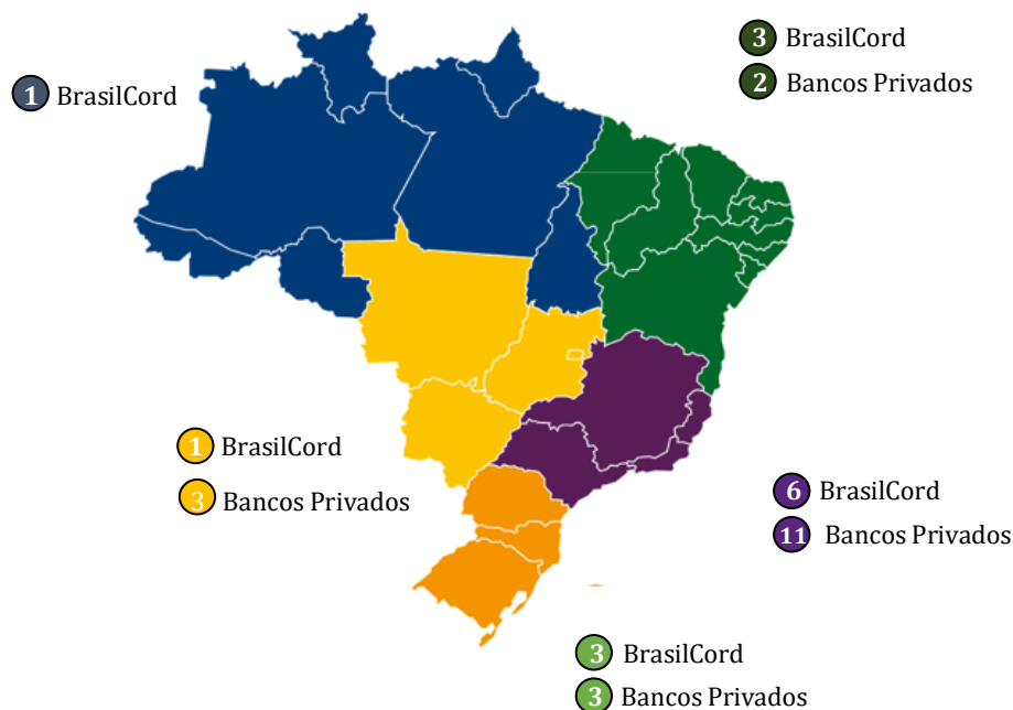
Figura 1. Distribuição dos Bancos de sangue de cordão umbilical e placentário em funcionamento, por Região do país. Brasil, 2018.