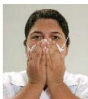
Figura 8 Verificação de vedação pelo teste de pressão positiva: cobrir a PFF com as mãos em concha sem forçar a máscara sobre o rosto e soprar suavemente. Ficar atento a vazamentos eventuais. Se houver vazamentos o respirador está mal colocado ou o tamanho é inadequado. A vedação é considerada satisfatória quando o usuário sentir ligeira pressão dentro da PFF e não conseguir detectar nenhuma fuga de ar na zona de vedação com o rosto.