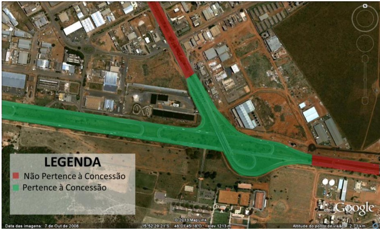
Obs.2: Croqui 2 - Interseção com a BR-060/GO