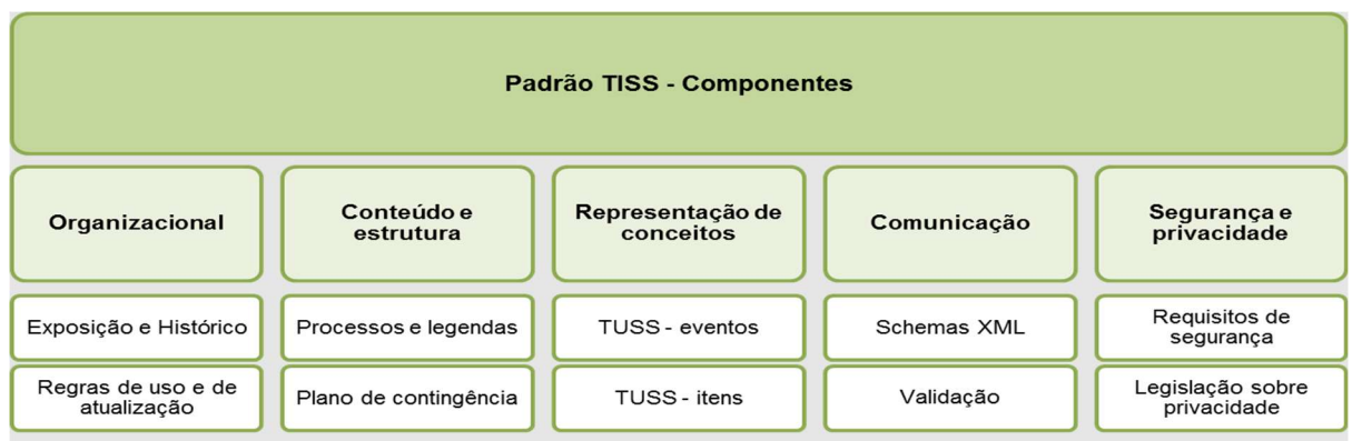
Figura 1 - Diagrama dos Componentes do Padrão TISS