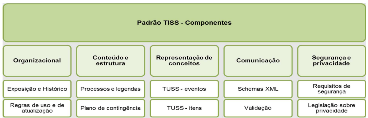
Figura 1 - Diagrama dos Componentes do Padrão TISS