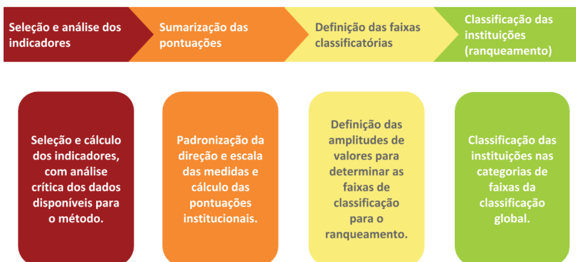
Figura 1. Etapas gerais do método de classificação global da qualidade hospitalar.

Digno de nota, a metodologia de classificação global da qualidade hospitalar também reporta uma classificação suplementar, onde categoriza separadamente cada uma das pontuações institucionais em uma das três categorias de desempenho (acima, igual ou abaixo do valor nacional) utilizando cada um dos indicadores gerais e estratificados. O objetivo dessas categorias é fornecer detalhes adicionais para as partes interessadas quanto ao desempenho hospitalar em áreas específicas.