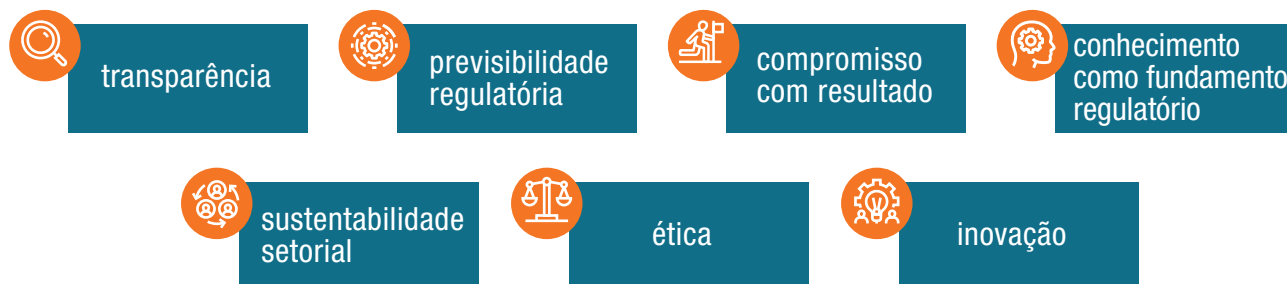
■ FIGURA 4 - VALORES INSTITUCIONAIS

Reafirmando sua missão de Promover a defesa do interesse público na assistência suplementar à saúde, regular as operadoras setoriais - inclusive quanto às suas relações com prestadores e consumidores – e contribuir para o desenvolvimento das ações de saúde no país, a ANS reforçou os seus valores institucionais no Planejamento Estratégico 2021-2025, conforme a figura 4.