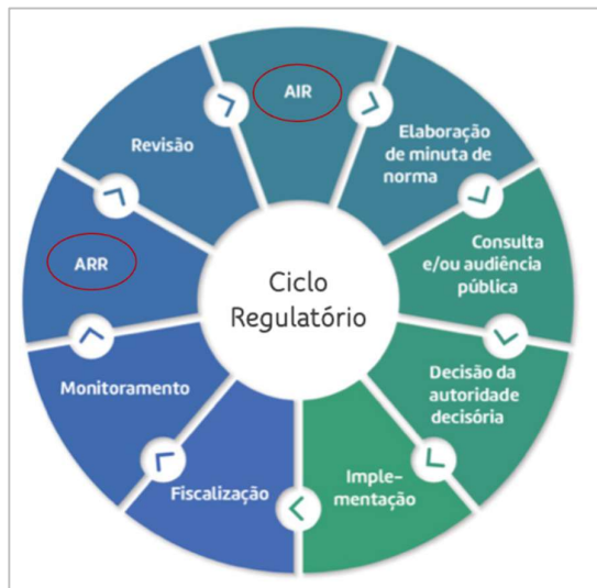
Figura 2. Ciclo Regulatório - Guia Orientativo para elaboração de ARR, Casa Civil 2022

Por fim, utilizar dados contábeis do período pandêmico sem ajustes adequados poderia levar a conclusões enviesadas, comprometendo a validade de análises atuariais e financeiras. A exclusão ou ajuste desses anos em estudos longos é uma prática recomendada para garantir resultados mais confiáveis.