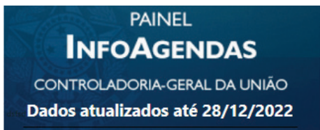
■ FIGURA 1 - PAINEL CGU - INFOAGENDAS