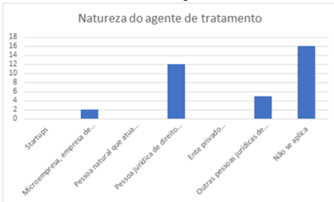
Gráfico 03 - Natureza do agente de tratamento.

2.11. Quanto ao setor de atuação, do total dos participantes, 25,71% assinalaram as opções “não se aplica” ou “outro”, 17,14% afirmaram representar o setor financeiro, 8,57%, o setor de tecnologia da informação, e o restante se distribuiu entre as outras opções, conforme apresentado no Gráfico 04: