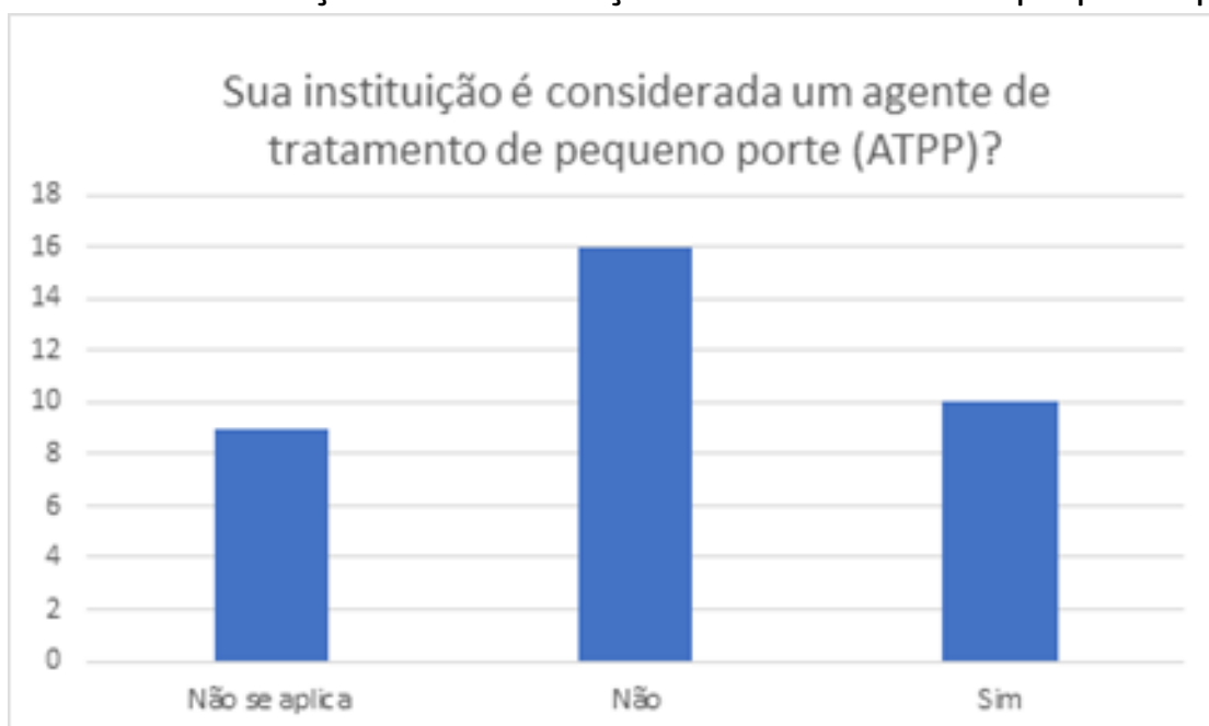
Gráfico 02 - Classificação se a instituição é considerada de pequeno porte.

2.9. De acordo com o regulamento de aplicação da LGPD para agentes de tratamento de pequeno porte (ATPP), esses agentes consistem em microempresas, empresas de pequeno porte, startups , pessoas jurídicas de direito privado, inclusive sem fins lucrativos, nos termos da legislação vigente, bem como pessoas naturais e entes privados despersonalizados que realizam tratamento de dados pessoais, assumindo obrigações típicas de controlador ou de operador, cerca de 28,57% dos participantes representavam ATPPs, conforme representado no Gráfico 02: