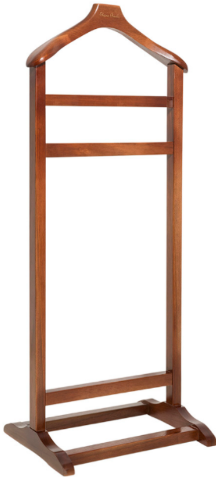
Imagem meramente ilustrativa. Os participantes poderão ofertar produtos com aspectos diferentes, desde que atendam às especificações técnicas. Assim, a mera reprodução de imagem ilustrativa de um determinado fabricante não implica, em nenhuma hipótese, preferência ou aceitação prévia por parte da ANPD.

(A proposta deverá vir acompanhada de catálogo apresentando as especificações, se possível com desenho técnico ilustrativo, do modelo ofertado)