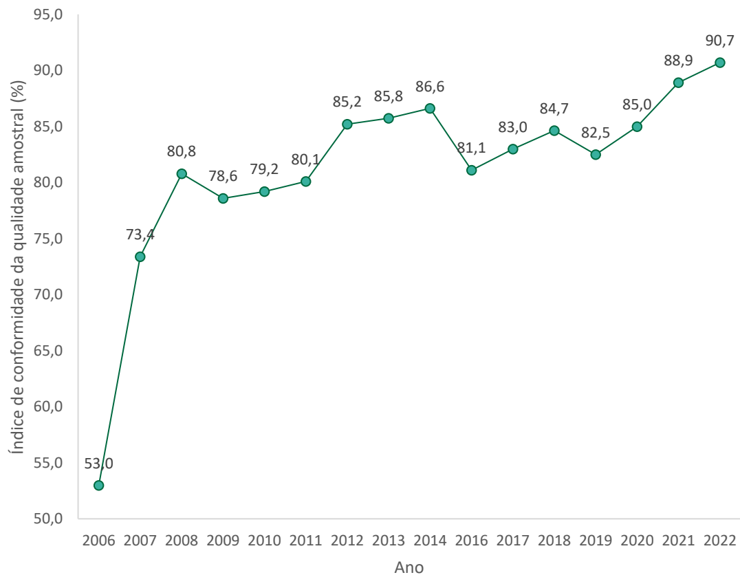
Índice de conformidade amostral (%)