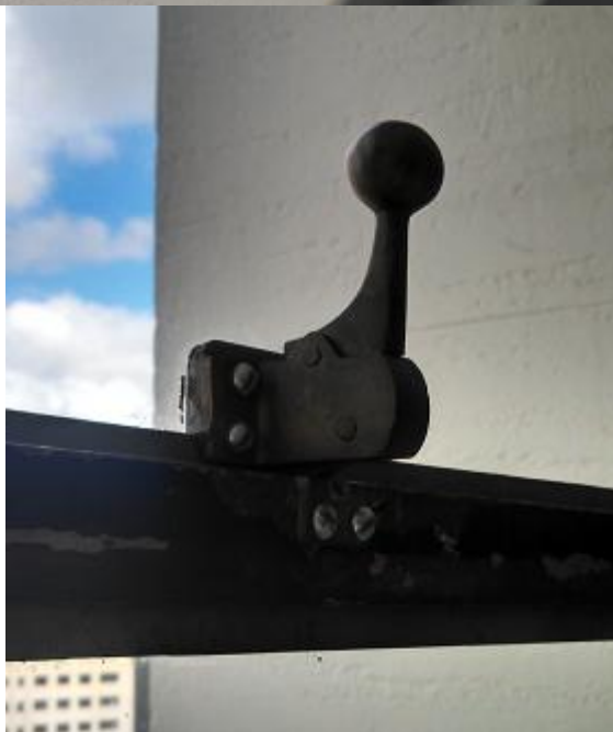
Fecho das janelas que serão retirados e substituídos por hastes articuladas para janelas maxim-ar