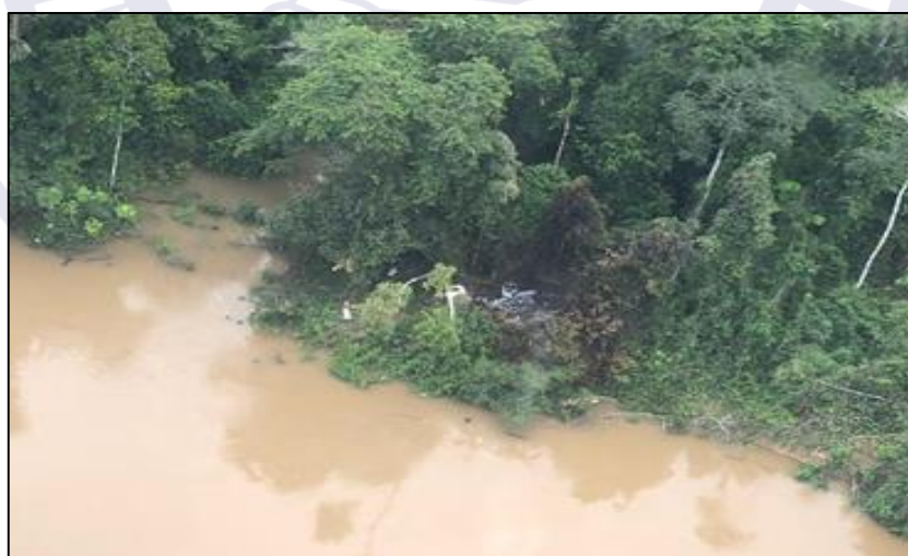
Figura 4 - Foto do local da ocorrência no dia seguinte ao acidente.

Outrossim, devido à localização do acidente em área isolada e de difícil acesso, distante 37 NM de Tabatinga e 595 NM de Manaus, o proprietário informou não possuir interesse em remover os destroços (Figura 4).