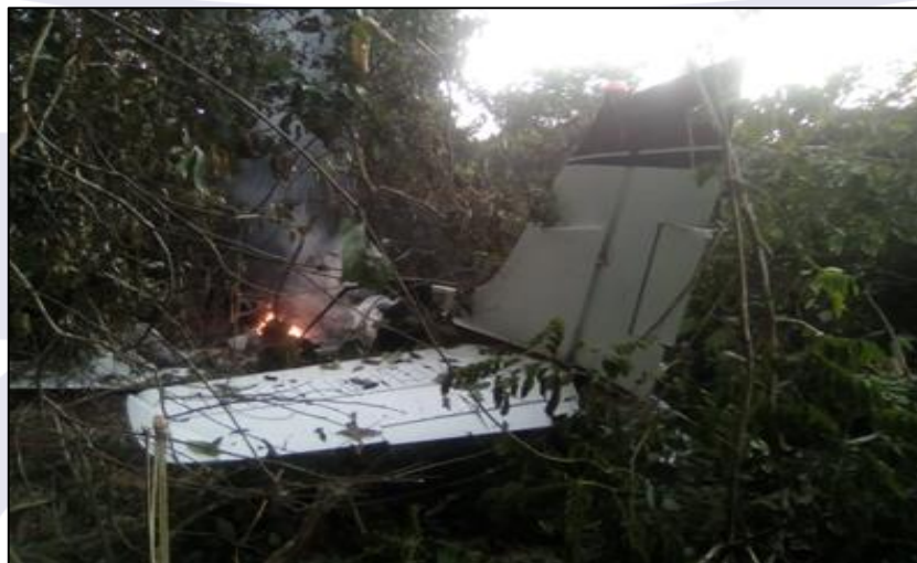
Figura 3 - Foto aproximada da aeronave ainda em chamas.

Dessa forma, é possível que o esquecimento de desligar os magnetos e os alternadores antes do pouso de emergência, o impacto e a ruptura dos tanques de combustíveis, somados a alguma corrente elétrica residual destes equipamentos possa ter provocado uma fagulha e iniciado o incêndio que consumiu a aeronave (Figura 3).