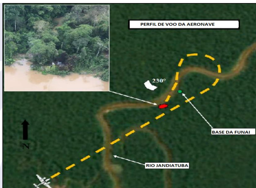
Figura 1 - Croqui da ocorrência.

O local era afastado 200 metros da base da FUNAI, localizada no município de São Paulo de Olivença, AM.