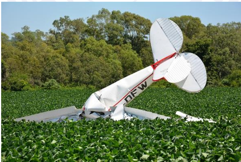
Figura 1 – Posição da aeronave após o impacto.

O profundor da aeronave apresentava um dano incompatível com o impacto da aeronave contra o solo, o qual impossibilitava seu movimento no sentido de picar, visto que emperrava no estabilizador horizontal.