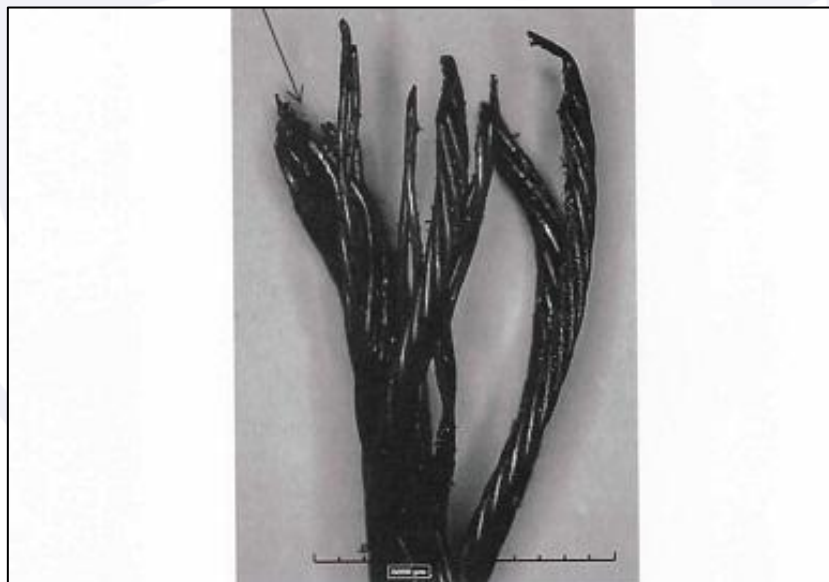
Figura 3 – Vista da ruptura por sobrecarga do cabo do compensador do profundor.

Devido aos danos decorrentes do acidente, não foi possível verificar se os ajustes de amplitude do profundor atendiam ao previsto no manual de manutenção da aeronave.