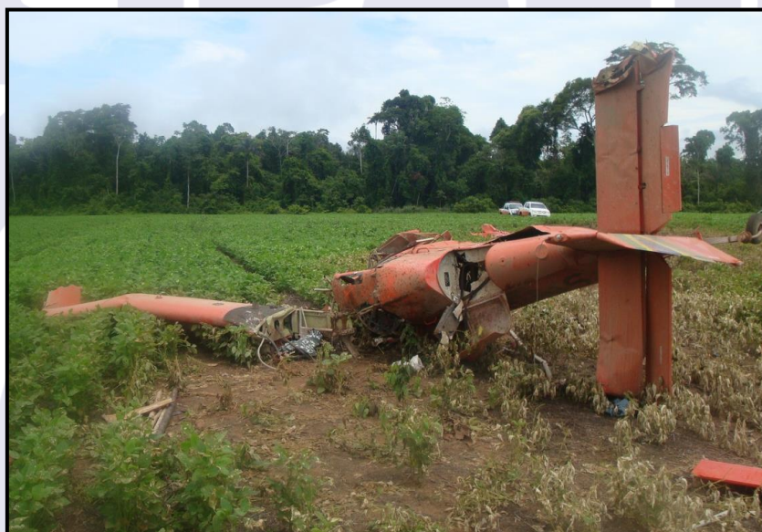
Figura 1 - Aeronave após o acidente.

A aeronave ficou destruída. O piloto sofreu lesões graves.