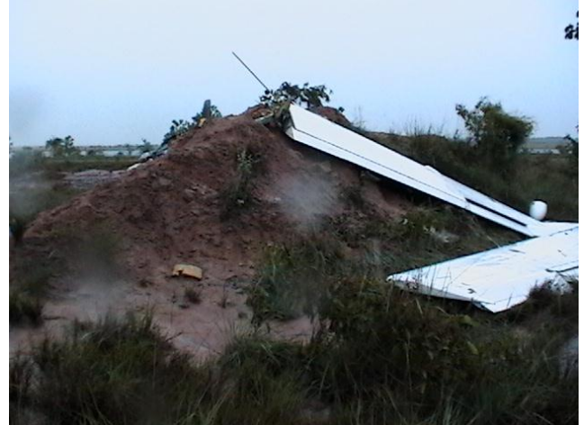
Figuras 1 e 2 - Situação dos destroços.