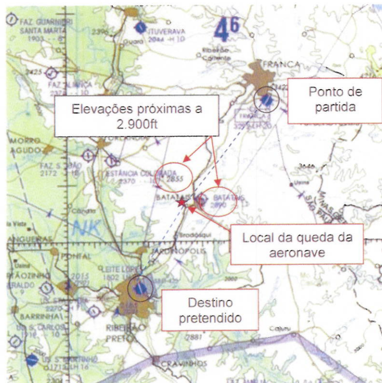
Figura 01- Carta WAC de São Paulo – Escala 1/1.000.000

Ao atingir 3.000ft, o piloto afirmou que “achou” que a aeronave estava com o modo “ALT” do PA engajado e não percebeu que a mesma continuou a descer lentamente até os 2.700ft.