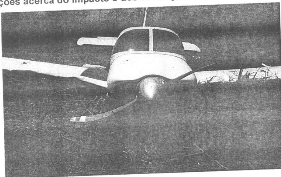
Fig. 1: Aeronave acidentada, com detalhe das pás da hélice.

O pouso forçado ocorreu em um terreno plano, com vegetação de caatinga, a aproximadamente 250 m da cabeceira da pista.