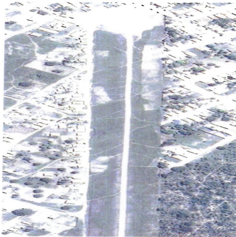
Figura Nº1 Vista do aeródromo de Coribe