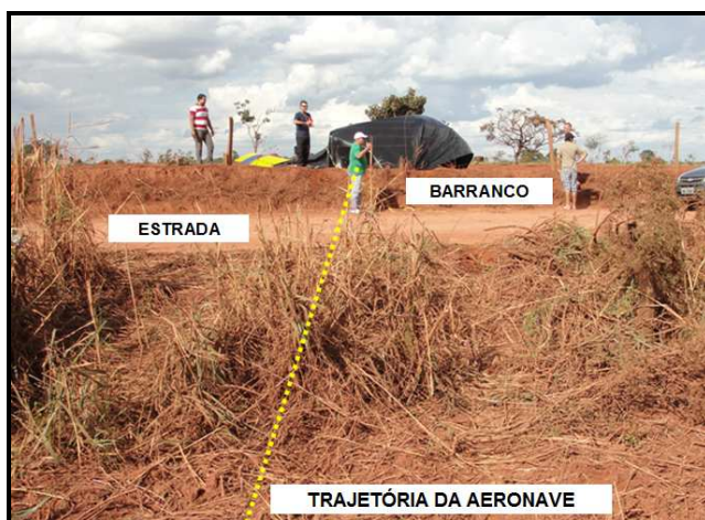
Figura 08 - Trajetória final da aeronave.