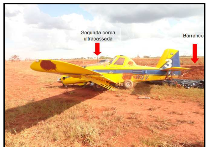
Figura 09 - Posição de parada da aeronave.