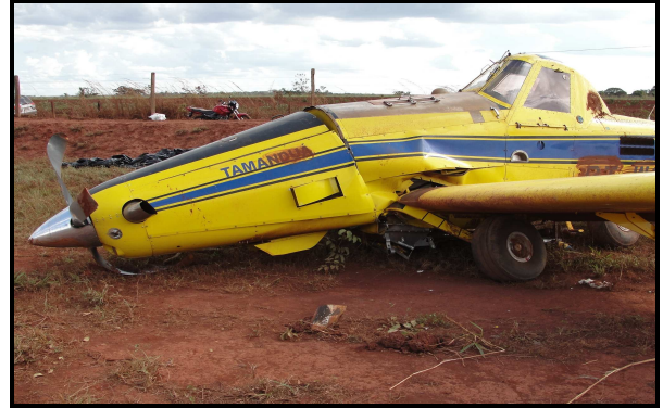
Figura 06 - Aeronave após a parada total.