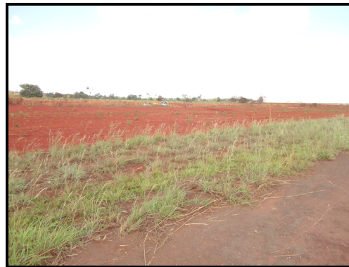
Figura 03 - Vista da área de escape na lateral esquerda da pista.

A área de escape, na lateral esquerda da pista, não possuía obstáculos e o piso era de terra fofa (não compactada).