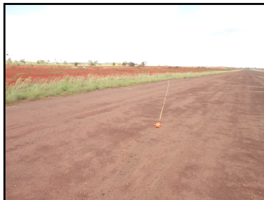
Figura 04 - Trajetória do pneu do trem principal esquerdo, no momento de saída da pista.

Após a saída da pista, a aeronave percorreu 120m até a posição de parada total.