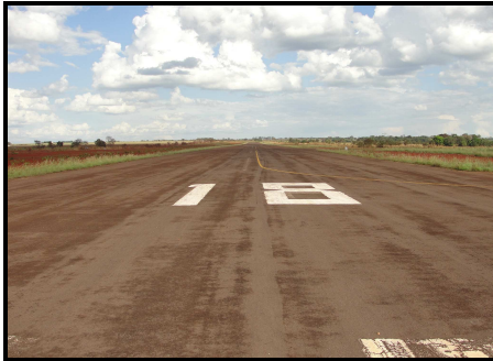
Figura 01 - Vista da pista 18 de SWTS.

O piso estava em condições regulares, sem desníveis acentuados para as laterais.