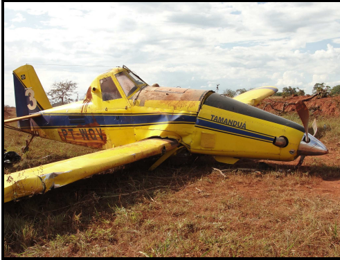
Figura 05 - Aeronave após a parada total.

Após ultrapassar a segunda cerca e o barranco, a aeronave impactou contra o solo e parou.