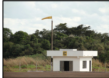
Figura 02 - Biruta existente no pátio de SWTS

A área de escape, na lateral esquerda da pista, não possuía obstáculos e o piso era de terra fofa (não compactada).