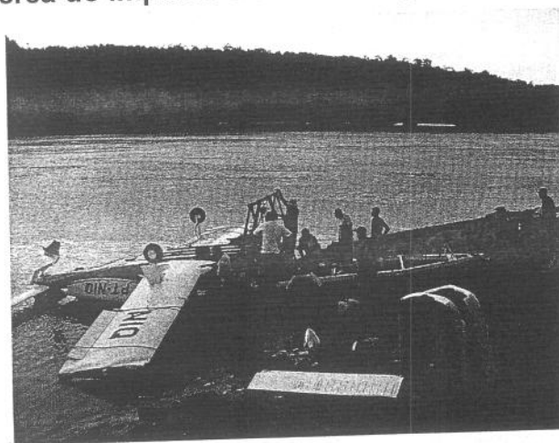
Aeronave durante a operação de retirada do rio

Após a amerissagem, a aeronave afundou na água e a correnteza a levou à posição de dorso.