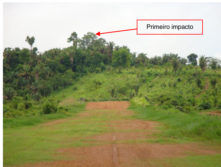
Figura nº1 Vista da pista de pouso no rumo 160 graus.

Após a arremetida a aeronave, voou cerca de 525 metros até se chocar contra a primeira árvore.