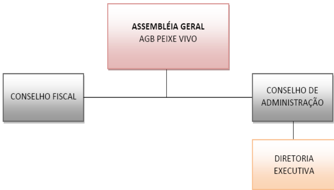
Figura 1 - Organograma geral da AGB Peixe Vivo

Diretoria Executiva - órgão executor das ações da AGB Peixe Vivo.