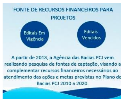
Figura 17 - Banner de acesso ao conteúdo relacionado a divulgação de Fontes de Recursos Financeiros para Projetos.

Desde o ano de 2013, a AGÊNCIA DAS BACIAS PCJ vem realizando a pesquisa de fontes de recursos financeiros para captação de recursos, visando verificar a possibilidade de apoio no atendimento as ações e metas previstas no Plano de Bacias PCJ 2010-2020, em atendimento ao Indicador 2A-1. Tais fontes são divulgadas no site da AGÊNCIA DAS BACIAS PCJ para que todos possam ter acesso. Além da disponibilidade no site, toda vez que uma nova fonte é disponibilizada, a informação é encaminhada por e-mail a todos os interessados cadastrados no mailing dos COMITÊS PCJ para conhecimento.