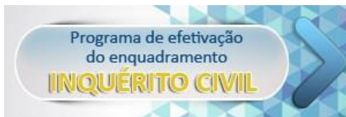
Figura 4 - Banner de acesso ao Inquérito Civil