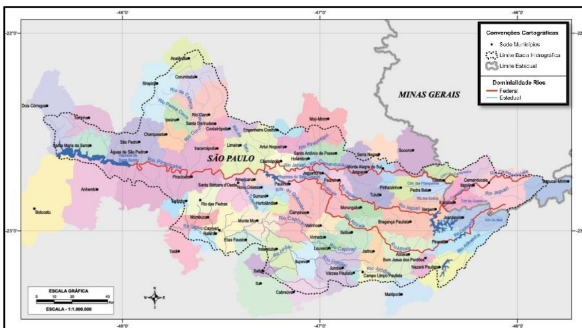
Mapa 1 - Bacias Hidrográficas dos Rios Piracicaba, Capivari e Jundiá (Bacias PCJ) - Divisão Política e Dominialidade dos Rios.

Criada e instalada conforme as Leis Estaduais (SP), n° 7.663/1991 e n° 10.020/1998. Entidade Delegatária das funções de Agência de Águas sob o Contrato de Gestão n° 003/ANA/2011.