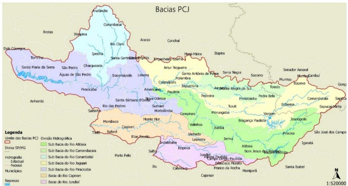
Mapa 2 - Bacias PCJ - Limites das Bacias PCJ e suas Sub-bacias