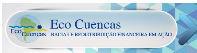
Figura 10 - Banner de acesso para o conteúdo do Eco Cuencas

Eco Cuencas é um projeto internacional de três anos iniciado em dezembro de 2014. Reúne nove parceiros latino-americanos e europeus em torno de uma ideia comum: A bacia hidrográfica é um espaço estratégico para lutar contra os efeitos das alterações climáticas. O orçamento do projeto é de 2,5 milhões de euros, financiados em 75% pela Comissão Europeia como parte de seu programa WATERCLIMA-LAC e um autofinanciamento de 25% proveniente das contribuições dos parceiros envolvidos no projeto.