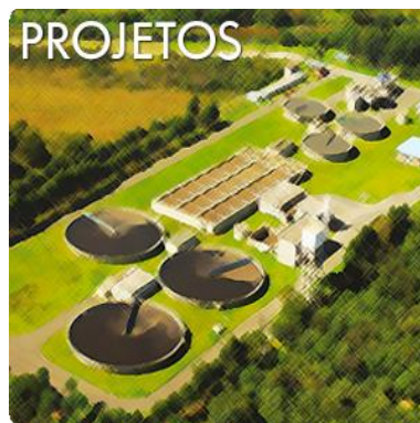
Figura 7 - Banner de acesso para o conteúdo relacionado a Projetos.

Todas as informações sobre as ações e projetos realizados pela AGÊNCIA DAS BACIAS PCJ estão disponíveis através do link http://www.agencia.baciaspcj.org.br/novo/projetos