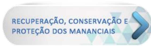
Figura 5 - Banner de acesso a Política de Recuperação Conservação e Proteção de Mananciais

Nesta sessão encontram-se informações sobre o histórico de criação da Política, seus programas, objetivos, projetos e ações, bem como informações sobre a atualização do Plano Diretor para Recomposição Florestal visando à Conservação de Água nas Bacias PCJ, das atribuições e trabalhos realizados pelo GT-Mananciais.