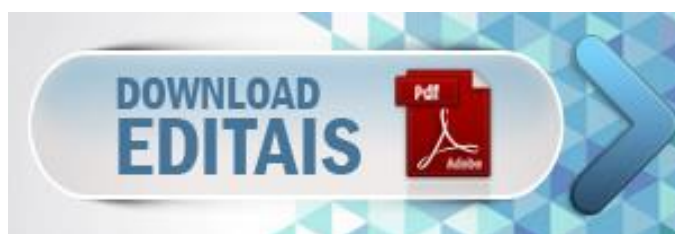
Figura 3 - Banner para acesso aos editais de licitação

O acesso às Licitações também pode ser feito através do banner abaixo, localizado na página inicial do site da AGÊNCIA DAS BACIAS PCJ: