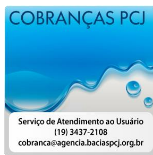
Figura 16 - Banner de acesso ao conteúdo relacionado as Cobranças PCJ

Nesta seção encontram-se disponibilizadas informações gerais relacionados à cobrança, tais como "banner para acesso ao SISCOB - Sistema de Cobrança PCJ - Módulo de Medição", "Declaração de Responsabilidade do Usuário em Cobrança", "O que é a Cobrança", "Quais os Valores Cobrados", "Quem arrecada e qual o destino dos Recursos Financeiros", "Simulador da Cobrança PCJ Paulista", "Base Legal (Federal, Estadual Paulista e Estadual Mineira)", "folderes referentes à Cobrança PCJ Paulista" e "Contato para Dúvidas".