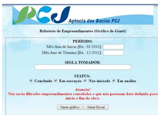
Figura 9 - Página do Relatório de Empreendimentos

No relatório de empreendimentos pode-se verificar o andamento de todos os projetos indicados e financiados com recursos das cobranças PCJ pelos Comitês, referente ao período