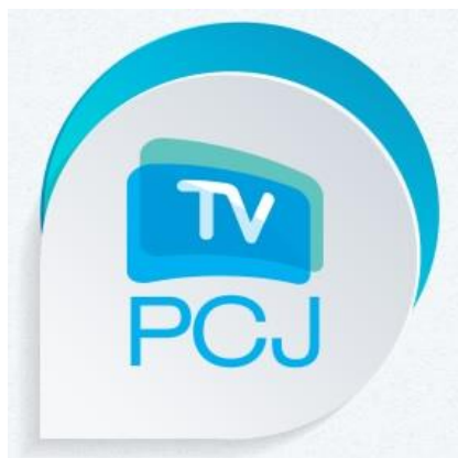
Figura 2 - Banner de acesso à TV PCJ

A TV PCJ foi uma iniciativa dos COMITÊS PCJ e da AGÊNCIA DAS BACIAS PCJ. Com uma proposta de mostrar o território das Bacias PCJ e seus 76 municípios. Com a produção da StandByMedia, o canal foi um meio de comunicação entre os COMITÊS PCJ e a sociedade. Os interessados em receber informações sobre a TV PCJ e seus programas poderão entrar em contato através do e-mail comunicapcj@agencia.baciaspcj.org.br