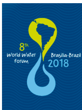
Figura 11 - Banner de Acesso ao 8º Fórum Mundial da Água

Criado em 1996 pelo Conselho Mundial da Água, o Fórum foi idealizado para estabelecer compromissos políticos acerca dos recursos hídricos. As edições anteriores aconteceram em Marrakesh, Marrocos (1997); Haia, Holanda (2000); Quioto, Shiga e Osaka, Japão (2003);