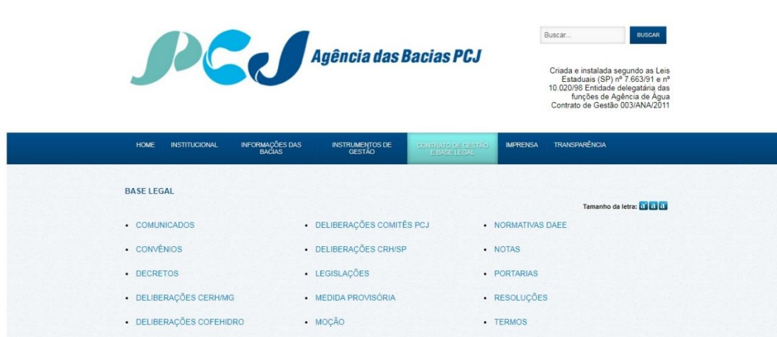
Figura 1 - Quadro contendo os links da Base Legal:

Cada item descrito no quadro, dá acesso ao seu respectivo conteúdo: