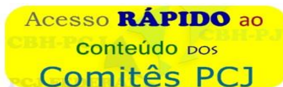
Figura 12 - Banner de acesso rápido às informações institucionais dos Comitês PCJ