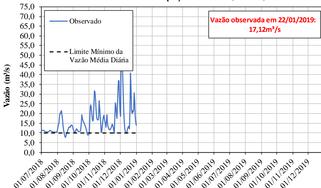
POSTO DE CONTROLE - Captção de Valinhos (3D-007T)

* Fonte de dados: Sistema de Alerta a Inundações de São Paulo (SAISP) - Fundação Centro Tecnológico de Hidráulica (FCTH)