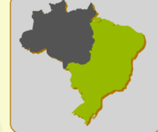
Localização da bacia: